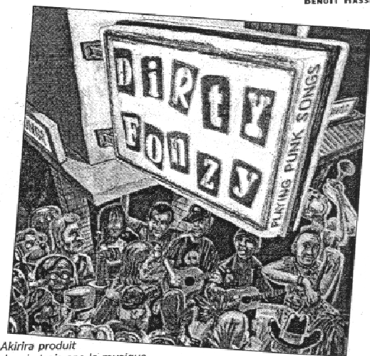
Akirira produit depuis trois ans la musique punk rock de ce groupe albigeois. (PROD.)