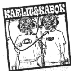
Ce groupe lyonnais propose un hip-hop « déjanté ».

Q UEL EST le point commun entre le label qui produit Amadou et Mariam, le « tourneur » qui organise les concerts de Mickey 3D ou la maison de disque de « No One Is Innocent » ? Réponse : Comme de nombreuses autres, ces petites entreprises musicales indépendantes se sont toutes installées dans le même îlot du nord du XVIII e , entre les rues Letord, Blémont et Messenger. Un quartier que l'association Mila 18 (traduisez le Marché indépendant des labels du XVIII e ) est en train de transformer en triangle d'or de la musique « indé ».